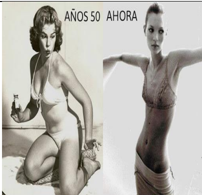
Medios de comunicación y el cuerpo “perfecto”

Ideal de Belleza: La belleza se experimenta y no es necesariamente estética y armónica, sino cambiante. Bello puede ser todo, lo extravagante, lo inusual y está basado en la independencia de cada persona que contempla.